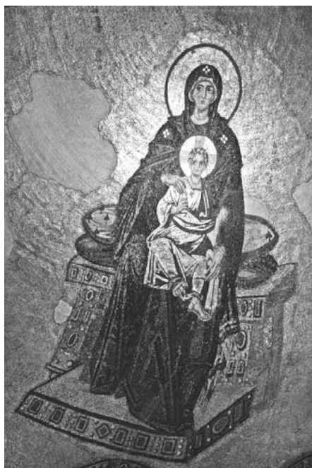
Рисунок 14. Богородица. Мозаика апсиды Софийского собора в Константинополе. Примерно 9 в.

принято сейчас в некоторых церквях, было физически невозможно, потому что они находятся на большой высоте, над входами в храм, на потолке и на сводах его.