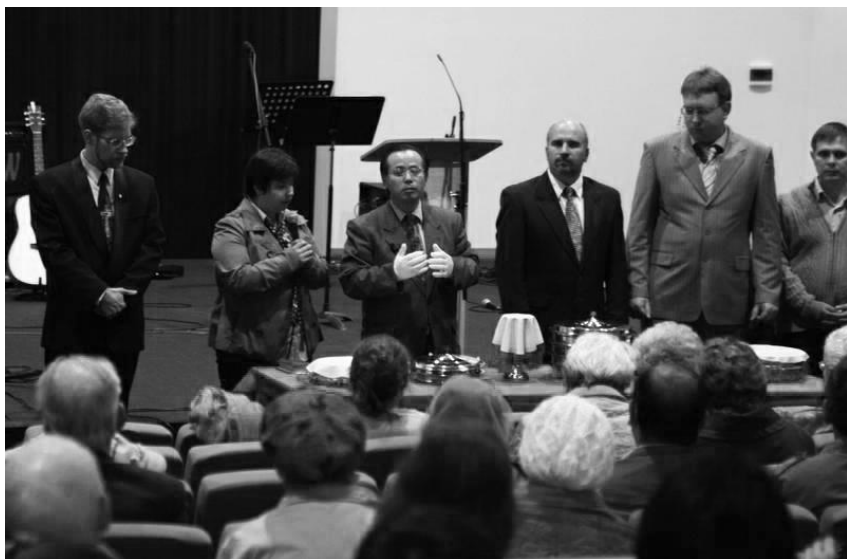
Рисунок 10. Вечеря Господня в Протестантской церкви.

Христос: «Горе вам, книжники и фарисеи, лицемеры, что даете десятину с мяты, аниса и тмина, и оставили важнейшее в законе: суд, милость и веру; сие надлежало делать, и того не оставлять (Матф.23:23)».