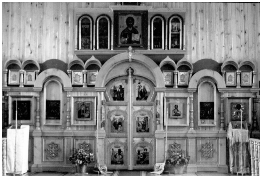
Рисунок 15. Алтарь в Древлеправославной церкви, храм с. Залесово.

период Священной истории: праотцов, пророков, праздники. Главным же рядом считался Деисусный (молитвенный), он достигал иногда до трех метров в высоту.