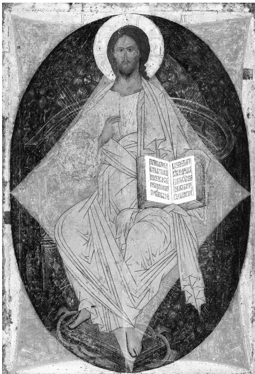
Рисунок 17. Андрей Рублев. Спас в силах (в славе).

Теперь «прочитаю» икону: о чем рассказывает нам иконописец. Думаю, что сделать это будет нетрудно, так как сюжет иконы прост и дан как бы послойно.