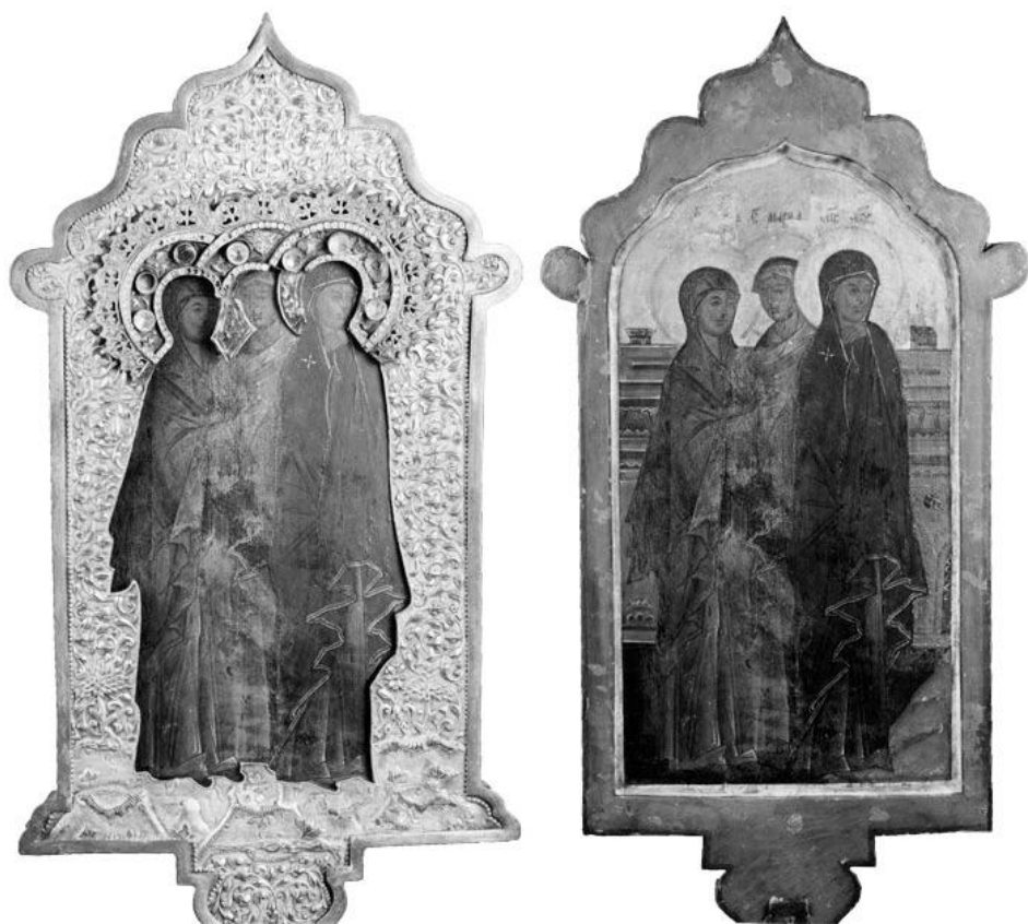
Рисунок 4. Богоматерь, Мария Клеопова и Мария Магдалина. Икона 19 в. из собрания СОИКМ им. П.В. Алабина

Между ними были Мария Магдалина и Мария, мать Иакова и Иосии, и мать сыновей Зеведеевых. (Матф.27:56)