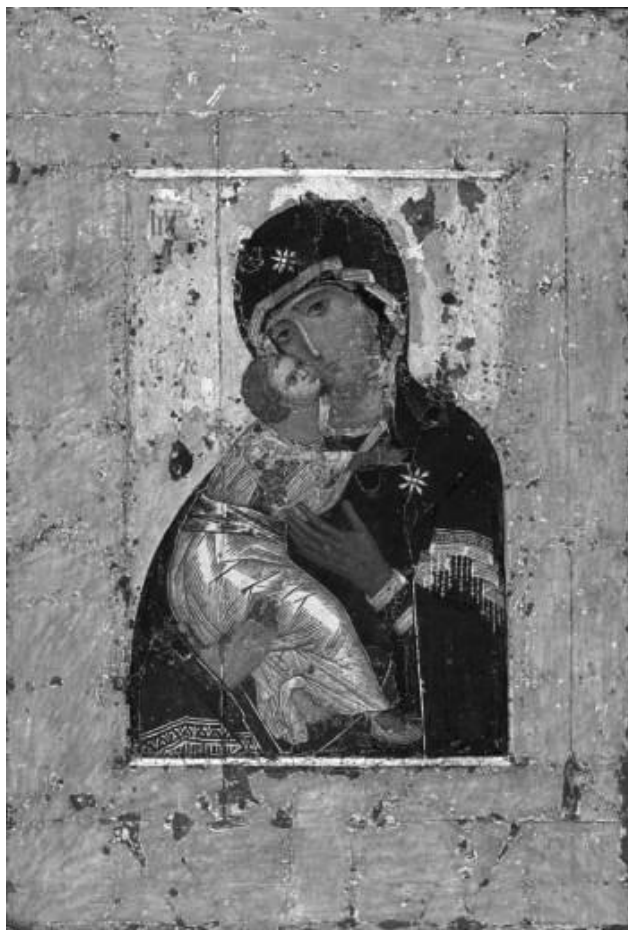
Рисунок 2. Богоматерь Владимирская. Икона 12 века.

Вот значения греческого слова πρωτότοκος , переведенного как Первенец : « первородный; рожденный прежде; (как сущ.) первенец ». Если непредвзято разуместь смысл данного слова, то оно, как ни крути, обозначает: рожденный первым, а не рожденный единственным; ведь обычно говорят: единственный ребенок, а не первый ребенок, когда говорят о женщине, имеющей лишь одного ребенка.