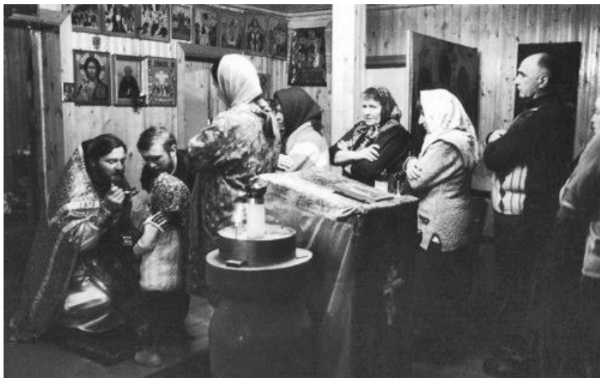
Рисунок 7. Причастие.

Хотя уже прошло много лет, но я хорошо помню, как волнительно и с каким упованием я ожидал своего первого причастия. Нам сказали, что перед Вечерей нужно взять пост и помолиться. Мы с женой старательно всё исполнили. И вот Вечеря! Я вкусил от хлеба и плода грозда виноградного и... ничего.