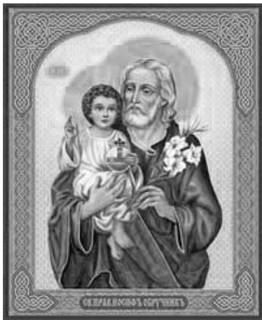
Рисунок 1. Иосиф с Иисусом.

Можно, конечно, предположить, что Мария жила с Иосифом не в роли его законной жены, а например, в роли его невесты – так называемой обручницы. Еще можно пофантазировать, что Иосиф и Мария сходились лишь раз в году для ежегодного (см. Лук.2:41) путешествия в Иерусалим. Но такие фантазии будут означать лишь одно: тогда мы должны признать, что Иосиф и Мария в глазах всего Израиля не считались бы законной семьей, ибо все считали, что Иисус – сын Иосифа и Марии. Да и в каких условиях рос бы тогда маленький Иисус, не имея нормальной семьи?