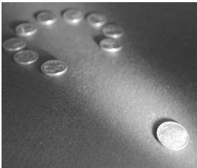
Рисунок 11. Разве может такая десятина служить духовному познанию Бога, и быть уподоблением Иисусу Христу?

По букве, повторяю, вы можете служить Богу лишь своими силами, но пусть попробует кто-либо своими силами пророчествовать или творить чудеса. Невозможно такое? А почему невозможно? Потому что служение пророчества или чудотворения – сугубо духовное служение: только когда Дух Святой сходит на человека, только тогда Он дает ему способность служить Своими дарами.