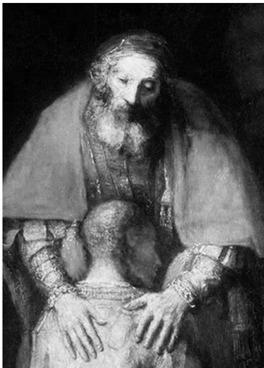
Рисунок 19. Рембрандт. Возвращение блудного сына (фрагмент).

«Сын мой старший, раздели со мною мою радость! Не ради брата, а ради меня, не огорчай меня в сей день,» – услышал не ушами, а сердцем своим праведный брат.