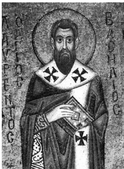
Рисунок 6. Василий Великий. Икона 11 века. Софийский собор, Киев.

Василий Великий в своей Беседе на Псалом сорок четвертый писал: «(9) Предста царица одесную Тебе, в ризах позлащенных одеяна преиспещрена (Пс.44:10). Пророк говорит уже о Церкви , о которой узнаем из Песни Песней (6:9), что едина есть совершенная голубица Христова, которая приемлет на десную страну Христову соделавшихся известными по своим добрым делам, различая их от людей негодных, как пастырь различает овец от козлищ. Итак, предстоит царица, то есть душа, сочетанная с Женихом-Словом, не обладаемая грехом, но соделавшаяся причастницею царства Христова, предстоит