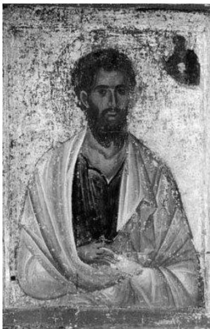
Рисунок 3. Иаков, брат Господень. Икона 18 в. Остров Патмос.

Чем интересен и ценен этот отрывок? Тем, что Евсевий Кесарийский – автор, наверно, самой первой книги по Истории Церкви, написанной по всем правилам исторической науки. А также тем, что в нем приведены цитаты из работ Климента Александрийского и Егезиппа – людей, живших во втором веке. Да и, вообще, думаю, вам будет небезинтересно узнать побольше о первом епископе Иерусалима, брате Господнем, Иакове.