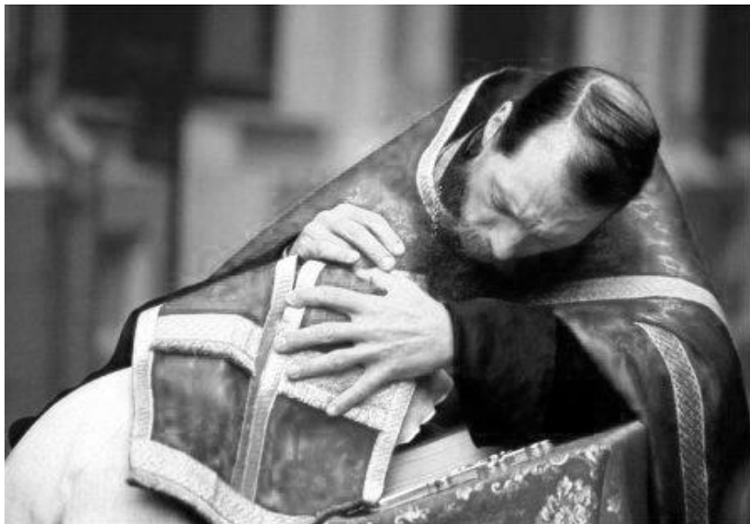
Рисунок 9. Таинство исповеди в Русской Православной Церкви.

себя, как его личный грех и принести эту скорбь уже в совместной с вами молитве к Господу Иисусу Христу. Дай Бог вам исповедать свой грех пред верующим, который готов слезами сердца своего омыть самое пыльное, грязное место вашей души.