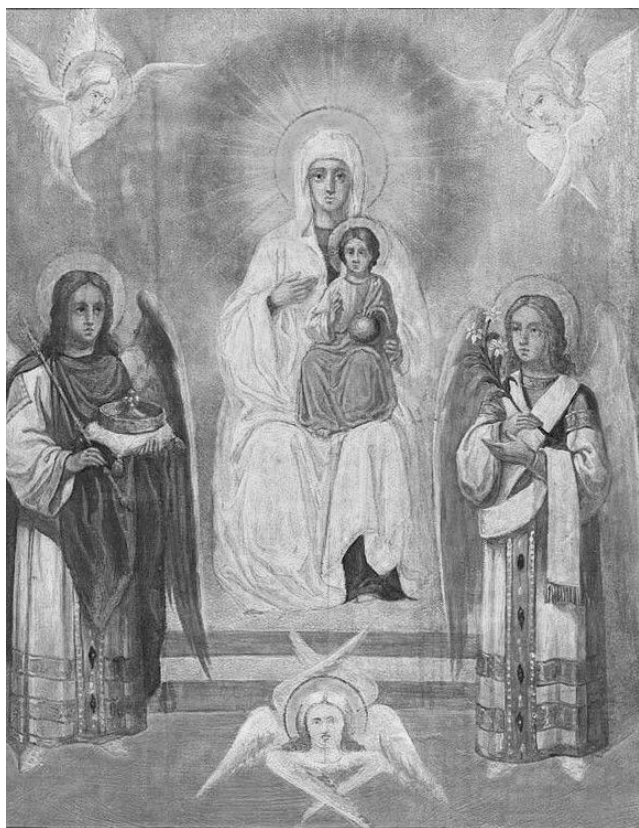
Рисунок 5. Богородица – Царица Небесная. Икона 19 века, Петербург.

Для объяснения этого пророчества надобно припомнить, что сидение и предстояние "одесную" царя издревле означало особенную почесть, принадлежавшую лицам близким к престолу. В объясняемом пророчестве Господь Иисус Христос представляется восседающим на престоле вечной славы, а предстоящая одесную Его – Пречистая Дева Матерь. Она предстоит на высшем месте, как честнейшая херувимов и славнейшая серафимов.» 44