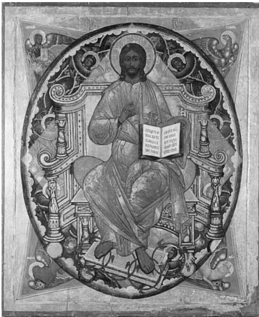
Рисунок 18. Спас в силах. Икона Преображенской церкви Спасо-Кижского погоста.

Второй иконописец взял известный всем сюжет и написал его, как ему показалось, лучше.