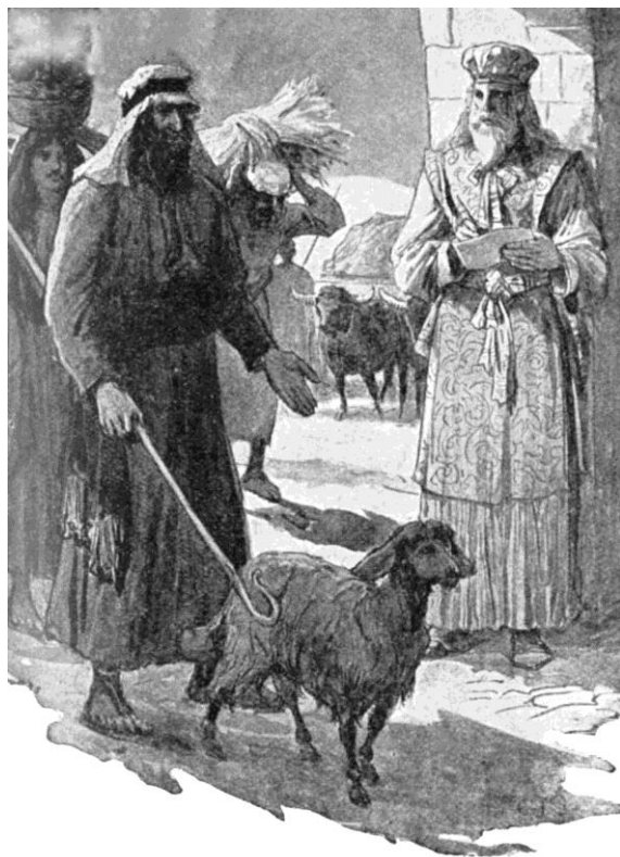
Рисунок 12. . Израиль приносит свои начатки и десятины в Дом Божий.

государственное, а «Божье». Они говорили: «Десятина принадлежит Богу», – говорили точно так, как говорили: «Налоги принадлежат государству», и... отдавали десятину. И отдав, уже не считаете эти деньги своими деньгами, и уже были равнодушны к ним. И уже не отягчали их карман оставшиеся 90%: ведь десятина Божья. И они уже не просили Бога: «Господи, дай разумение использовать всё, что Ты дал нам (не оставшиеся 90%, а все 100%), так чтобы угодить Тебе». И они уже не спрашивали у Бога: «Господи, а угодно ли Тебе я поступаю с деньгами?». Зачем спрашивать? Ведь они уже принесли в храм свою десятину!