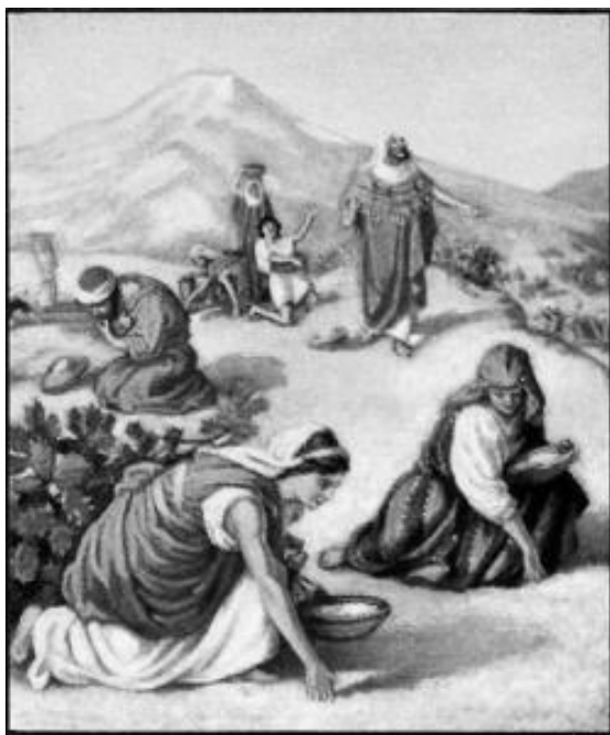
Рисунок 13. Израиль в пустыне: поутру все способные трудиться выходили собирать манну небесную.

И если евреи нарушали Божье повеление (но это не закон), тут же «аромат» смерти наполнял их жилище: «Но не послушали они Моисея, и оставили от сего (манны) некоторые до утра, — и завелись черви, и оно воссмердело. (Исх.16:20)».