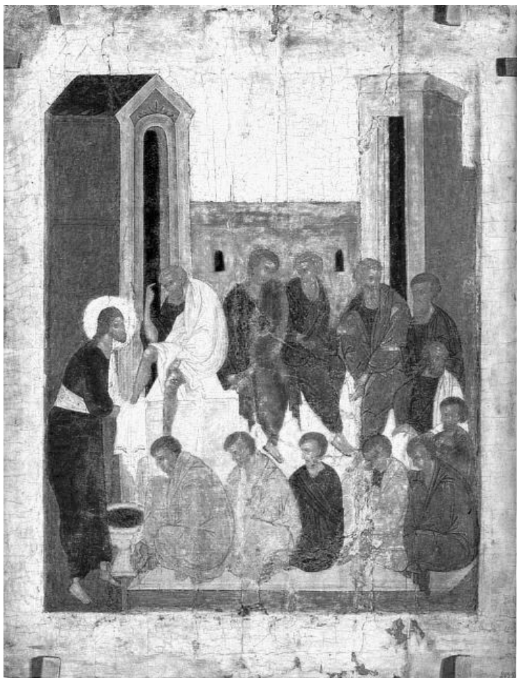
Рисунок 8. Иисус Христос моет ноги Своим ученикам. Икона Успенского собора Кирилло-Белозерского монастыря.

Теперь по порядку расскажу вам, дорогие читатели, о тех вопросах, которые возникли у меня при чтении этого места Священного Писания. И главный из них: чего ученики не могли уразуметь тогда из содеянного Иисусом Христом? Что постигли лишь после, когда Святой Дух открыл им истинный, духовный смысл действий и слов Господа на Вечере?